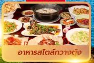
อาหารสตรีตฟู้ดกวางตุ้ง