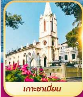
เกาซาเมี่ยน