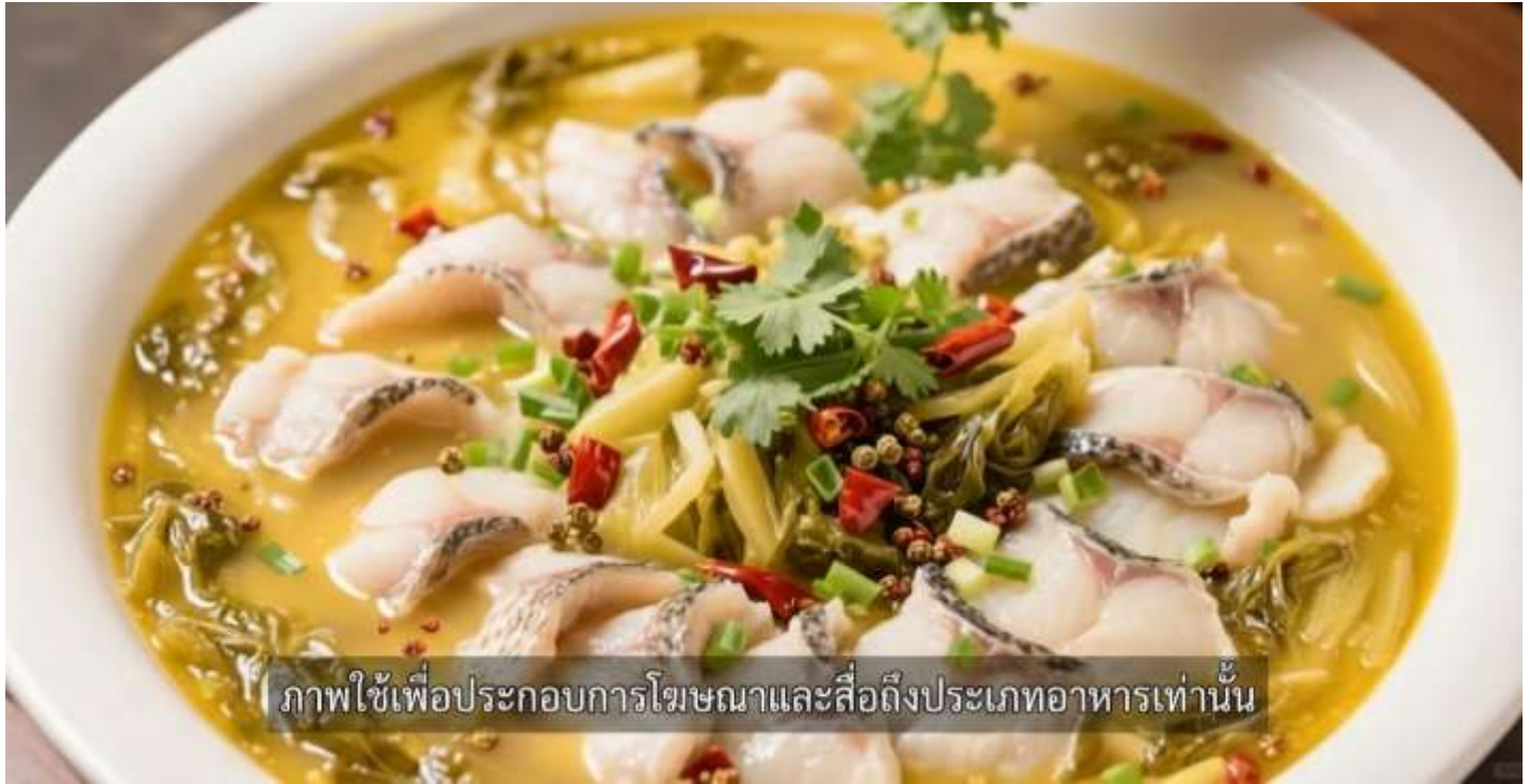
ภาพใช้เพื่อประกอบการโฆษณาและสื่อถึงประเภทอาหารเท่านั้น