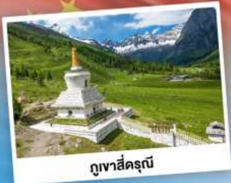
กู๋เจาสีครุณี

เที่ยว 2 อุทยาน กู๋เจาสีครุณี & ปี้ฝิงโกว เดินชมหมีแพนด้าสุดน่ารัก ใกล้ชิดกับแพนด้าแดง