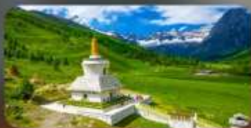
กู๋เจาสีครุณี