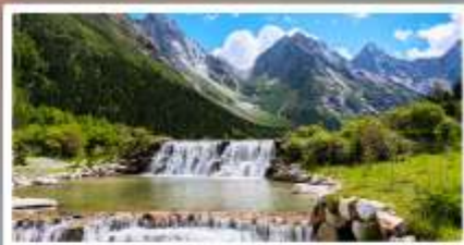
ปี้ฝิงโกว