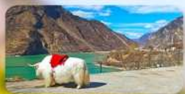
ทะเลสาบเค่อซี