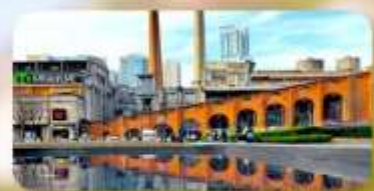
ตงเจียวจื่ออี้