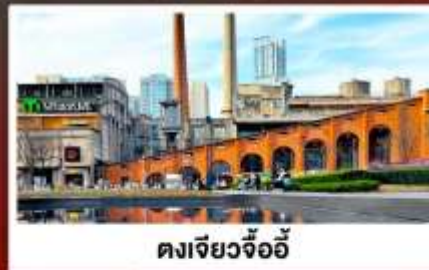
ตงเจียวจ้ออ๋