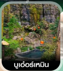
บูเออร์เหมิน