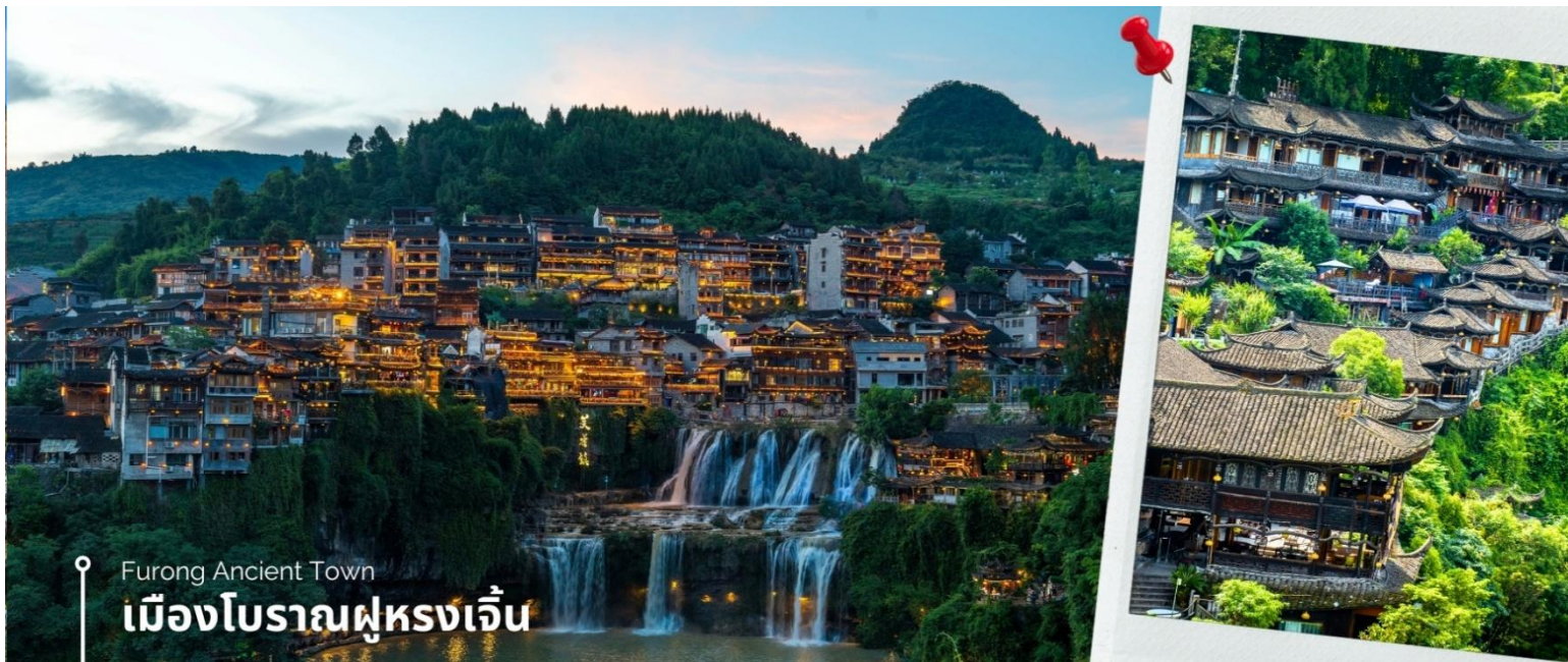
Furong Ancient Town

ท่านสามารถ ชมโชว์วัฒนธรรมผู่หงโบราณ (หากสภาพอากาศไม่อำนวย จะงดการแสดง) จากนั้นนำท่าน ชมความงาม น้ำตกผู่หง ซึ่งเป็นเอกลักษณ์ของเมืองผู่หง เป็นน้ำตกที่อยู่ใจกลางเมือง ถ้ามองจากฝั่งตรงข้ามจะดูเหมือนว่าเมืองตั้งอยู่บน หน้าผาที่มีน้ำตกไหลอยู่ข้างล่าง น้ำตกนี้มีขนาดกว้างประมาณ 40 เมตร และสูงประมาณ 60 เมตร ซึ่งความพิเศษอีกอย่าง ของที่นี่คือ เราสามารถเดินผ่านด้านหลังม่านน้ำตกได้