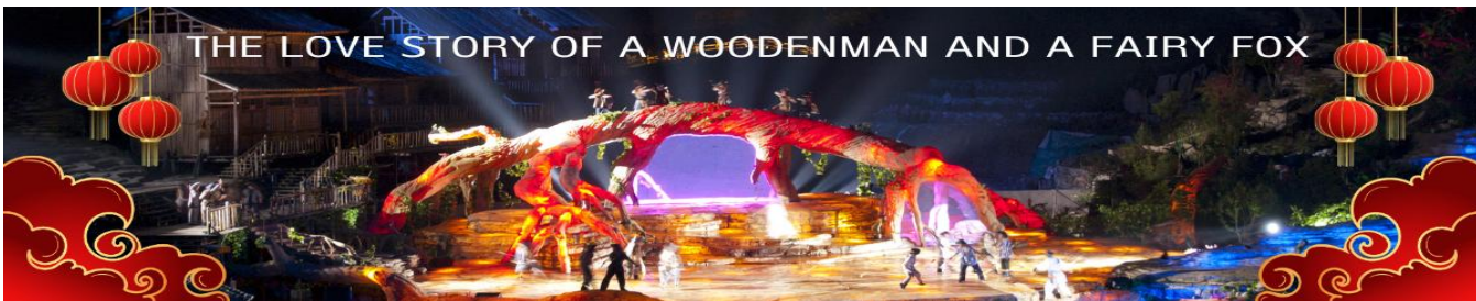
THE LOVE STORY OF A WOODENMAN AND A FAIRY FOX

โชว์สุดอลังการกลางแจ้ง ที่สุดของความโรแมนติกและอลังการ โดยผู้กำกับชื่อดัง “จางอีโหมว” ยอดผู้กำกับระดับโลกชาวจีน รับฟังเพลงรักไพเราะจับใจ ชมนักแสดงกว่า 500 ชีวิตโลดแล่นอยู่บนเวทีกลางแจ้ง โดยมีฉากหลังเป็นภูเขาทอดยาวแบบพาโนรามา ชมเทคนิคการเปลี่ยนร่างเป็นมนุษย์ของนางจิ้งจอกขาว ซาบซึ้งตรึงดวงใจในความรักของจิ้งจอกสาวแสนสวย และชายหนุ่มตัดฟันที่ฝ่าฟันอุปสรรคต่อสู้เพื่อความรักจนทำที่สุดก็สมหวังในชีวิตคู่และจบแบบ HAPPY ENDING