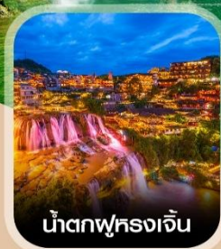
น้ำตกฟูหลงเจิน