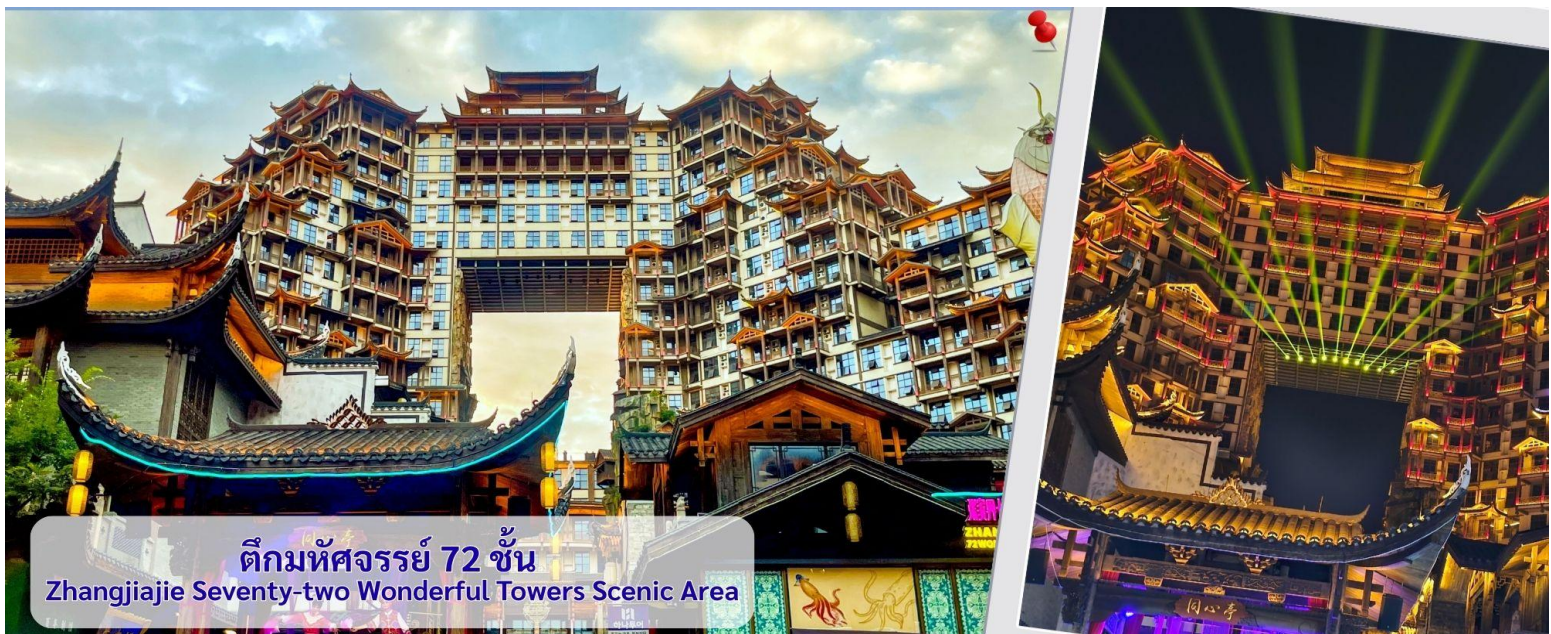
ตึกมหัศจรรย์ 72 ชั้น Zhangjiajie Seventy-two Wonderful Towers Scenic Area

เที่ยง 📍 รับประทานอาหารเที่ยง ณ ภัตตาคาร (10)