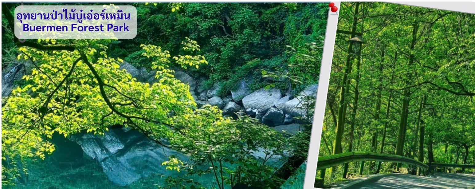
อุทยานป่าไม้บูเออร์เหมิน Buermen Forest Park

นำทุกท่านเดินทางสู่ อุทยานป่าไม้บูเออร์เหมิน (วนอุทยานแห่งชาติหูหนาน จางเจียเจี๋ย) อุทยานแห่งนี้ได้รับการประกาศเป็น อุทยานป่าไม้แห่งชาติของจีน (National Forest Park) ในปี 2006 เป็นสถานที่ท่องเที่ยวทางธรรมชาติและวัฒนธรรม ตั้งอยู่ใน จังหวัดเซียงซี มณฑลหูหนาน ซึ่งเป็นพื้นที่ใกล้เคียงกับเมืองจางเจียเจี๋ย (ประมาณ 2 ชั่วโมงจกจางเจียเจี๋ย) ครอบคลุมพื้นที่กว่า 5,000 เฮกตาร์ โดยมีพื้นที่ป่าไม้ถึง 92% ของอุทยาน โดดเด่นในเรื่องของโขดหินรูปทรงประหลาด บ่อน้ำพุร้อนธรรมชาติ และงานแกะสลักหินโบราณ โดยเฉพาะเพื่อแช่น้ำพุร้อนและชมธรรมชาติภูเขาหินสวย ๆ