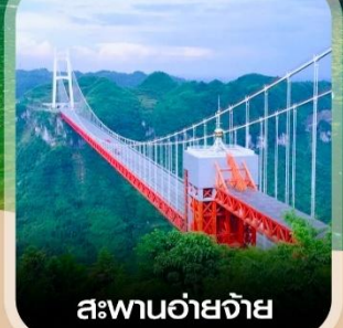
สะพานอ้ายจ้าย