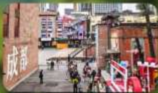
ตงเจียวจื่ออี้