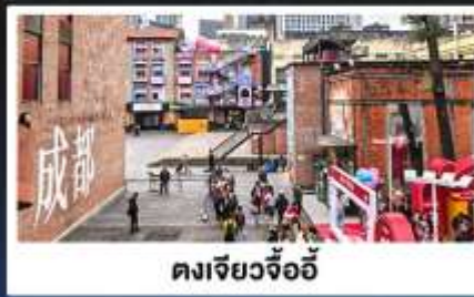
ตงเจียวจื่ออี้