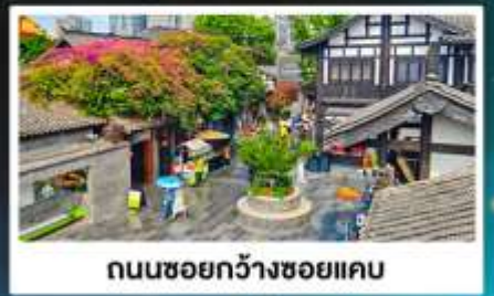
ถนนชอยกว้างชอยแคว