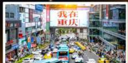
ถนนอาหารถวอนอินเดีย