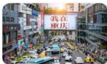
ถนนอาหารถวนอันเฉียว