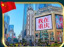
ถนนคนเดินเจียฟางเป็ย