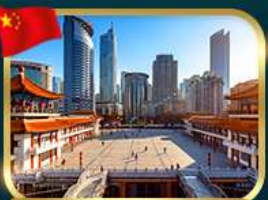
เข็คอินตึกไค่วังโหล