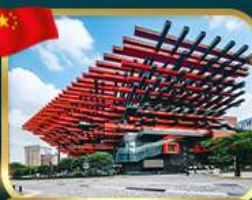
แลนด์มาร์กจั๊ว ตึกตะเกียบ