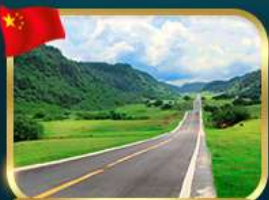
ชมวิวยุทยานชานานพี้