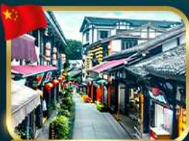
หมู่บ้านโบราณฉือซีฮั่ว

เที่ยวอุทยานหลุมพี้สะพานสวรรค์ + ชานานพี้