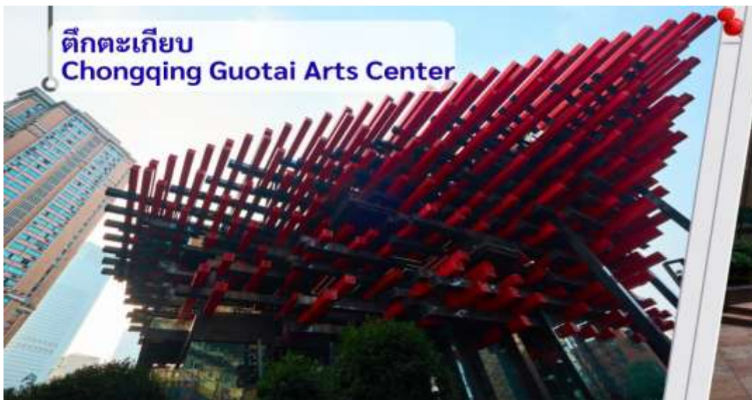
ตึกตะเกียบ Chongqing Guotai Arts Center

จากนั้นอิสระถ่ายรูปหน้าตึกตะเกียบ ฉงชิ่ง(ด้านนอก) คือ ฉงชิ่งกั๋วไท่อาร์ตเซ็นเตอร์ (Chongqing Guotai Arts Center) เป็นแลนด์มาร์คสำคัญที่มีสถาปัตยกรรมคล้ายตะเกียบยักซ์สีแดงและดำวางซ้อนกัน เป็นศูนย์จัดแสดงงานศิลปะและสถานที่ท่องเที่ยวที่นิยมสำหรับการถ่ายรูป โดยเฉพาะในเวลากลางคืนเมื่อเปิดไฟสวยงาม สิ่งก่อสร้างอันมีเอกลักษณ์ อาคารนี้ถูกวางโครงสร้างให้มีรูปร่างคล้ายกอง "ตะเกียบยักซ์" สีดำและแดงที่วางซ้อนกันเป็นชั้นๆ ที่ส่วนปลายของตะเกียบสีแดงจะมีตัวอักษรจีนคำว่า "กั๋ว" ประทับอยู่ ซึ่งมีความหมายถึง ชาติหรือประเทศ ส่วนที่ปลายตะเกียบสีดำ จะมีอักษรจีนคำว่า "ไท่" ประทับอยู่ ซึ่งหมายถึง ความเจียบสงบ หรือความอุดมสมบูรณ์