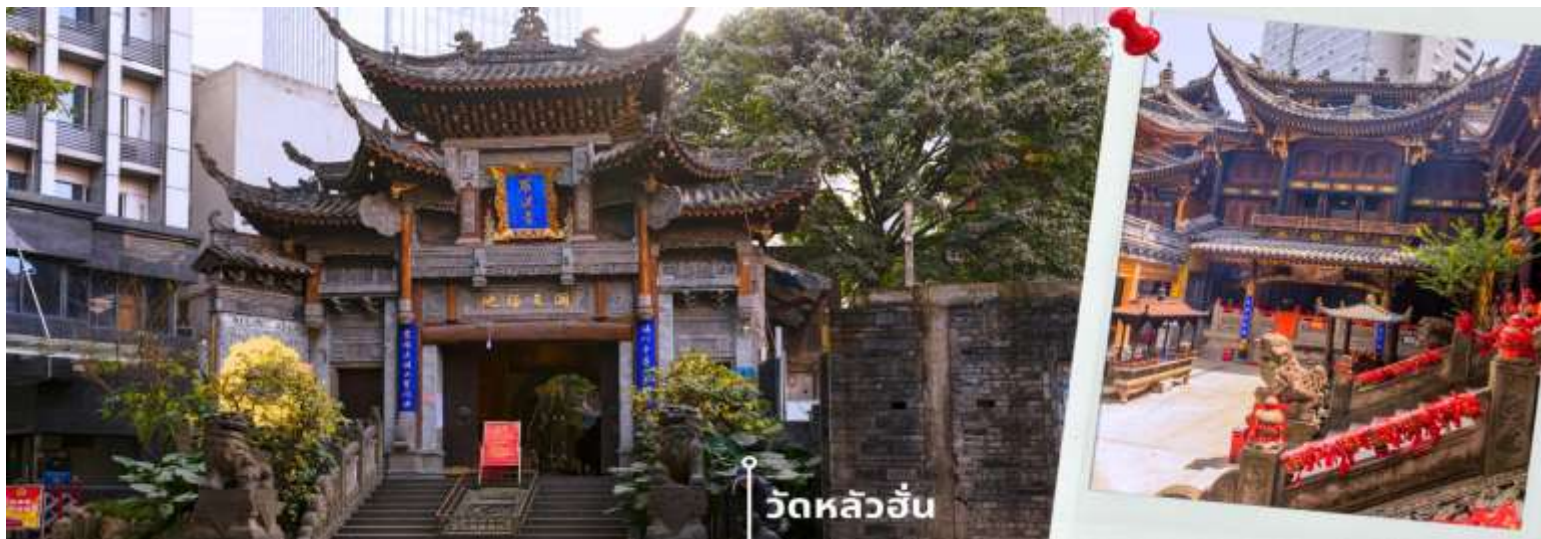
วัดหลัวอัน