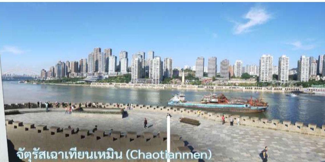
จัตุรัสเฉาเทียนเหมิน (Chaotianmen)

จากนั้นอิสระถ่ายรูปหน้าตึกตะเกียบ ฉงชิ่ง(ด้านนอก) คือ ฉงชิ่งกั๋วไท่อาร์ตเซ็นเตอร์ (Chongqing Guotai Arts Center) เป็นแลนด์มาร์คสำคัญที่มีสถาปัตยกรรมคล้ายตะเกียบยักซ์สีแดงและดำวางซ้อนกัน เป็นศูนย์จัดแสดงงานศิลปะและสถานที่ท่องเที่ยวที่นิยมสำหรับการถ่ายรูป โดยเฉพาะในเวลากลางคืนเมื่อเปิดไฟสวยงาม สิ่งก่อสร้างอันมีเอกลักษณ์ อาคารนี้ถูกวางโครงสร้างให้มีรูปร่างคล้ายกอง "ตะเกียบยักซ์" สีดำและแดงที่วางซ้อนกันเป็นชั้นๆ ที่ส่วนปลายของตะเกียบสีแดงจะมีตัวอักษรจีนคำว่า "กั๋ว" ประทับอยู่ ซึ่งมีความหมายถึง ชาติหรือประเทศ ส่วนที่ปลายตะเกียบสีดำ จะมีอักษรจีนคำว่า "ไท่" ประทับอยู่ ซึ่งหมายถึง ความเจียบสงบ หรือความอุดมสมบูรณ์