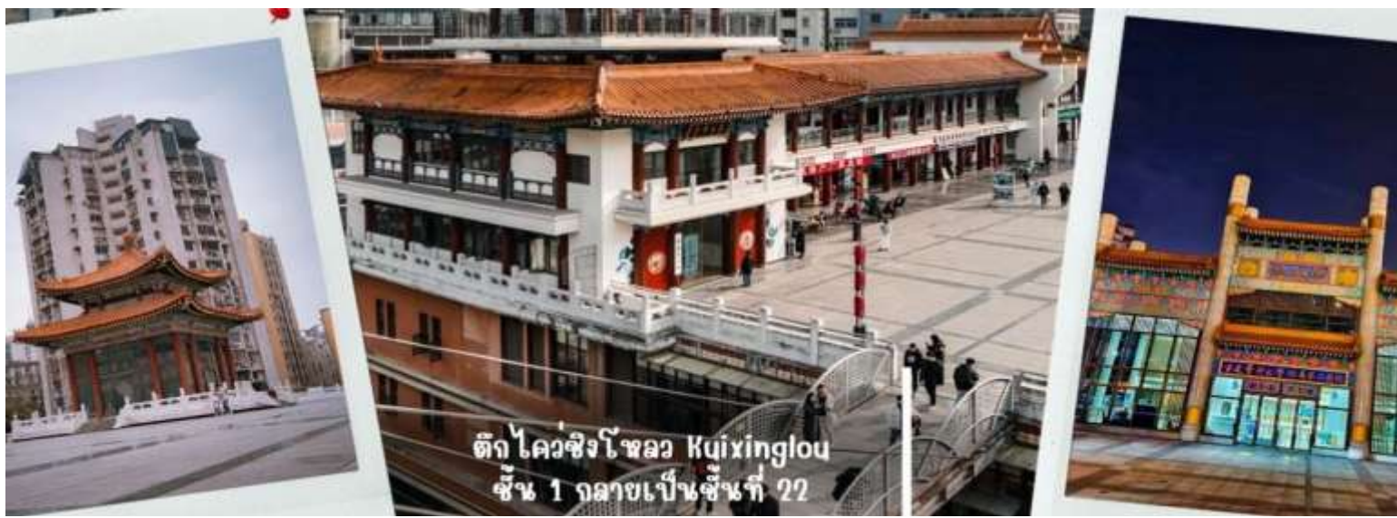
ตึก ไควชิงโหลว Kuixinglou ชั้น 1 กลายเป็นชั้นที่ 22

นำท่านเดินทางไปชมความแปลกใหม่ที่ ตึกไควชิงโหลว (ตึก 22 ชั้น) Kuixinglou ชั้น 1 กลายเป็นชั้นที่ 22 ของอีกฝั่ง อาคารเก่าแก่ดั้งเดิมหัตถ์จรรยา ยังเป็นสถานที่ถ่ายทำภาพยนตร์เรื่อง "Young You" โดย Yi Yang Qianxi "Kui Xing Tower" อาคารโบราณที่ตั้งอยู่ในเมือง ที่นี้ได้รับการต่อเติมและสร้างขึ้นใหม่ในปี 1991 สิ่งมหัศจรรย์ที่สุดที่นี่ไม่ใช่ตัวอาคาร แต่เป็นสะพานแขวนสองแห่งระหว่างจัตุรัสกับอาคารสำนักงาน สะพานแขวนที่เต็มไปด้วยรูปกลมเชื่อมระหว่างชั้น 1 ของจัตุรัสกับชั้นบนสุดของชั้น 22 ฝั่งตรงข้ามมองลงมาจากชั้น 1 จะเห็นได้ว่าด้านล่างมี 22 ชั้น เป็นอาคารที่มีลักษณะพิเศษที่เมืองฉงชิ่ง ประเทศจีน เนื่องจากภูมิประเทศที่เป็นภูเขา อาคารแห่งนี้จึงมีทางเข้าในระดับที่ต่างกัน เป็นจุดถ่ายรูปและชมวิวที่โดดเด่นของเมืองฉงชิ่งที่ได้ชื่อว่าเป็น "เมืองสามมิติ"