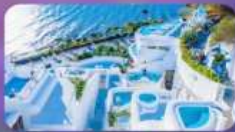
ชาโตริณี