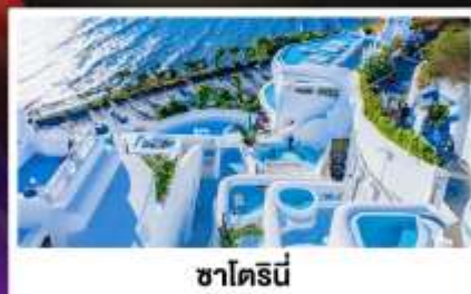
ซาโดรนี่