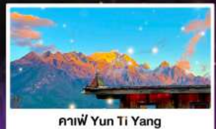
กาแฟ Yun Ti Yang