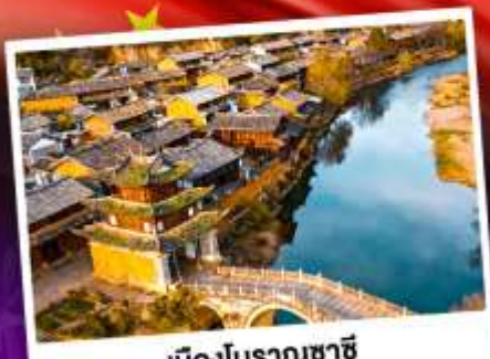
เมืองโบราณซาซี

ชมดอกไม้บานสะพรั่งทั่วยูนนาน "เซ็ดอีนดาเฟ้วว้าสุดอลัง"