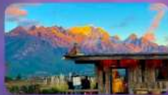
คาเฟ่ Yun Ti Yang