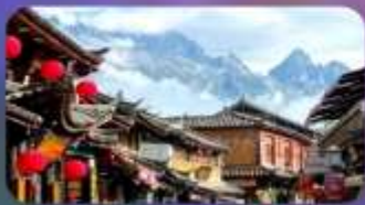
เมืองโบราณซาซี