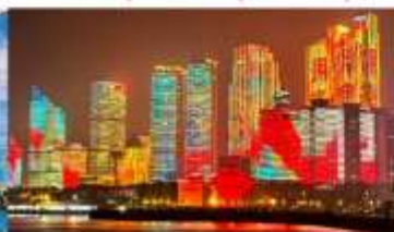
อ่าวฟูซาน