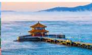
สะพานจ้านเจียว