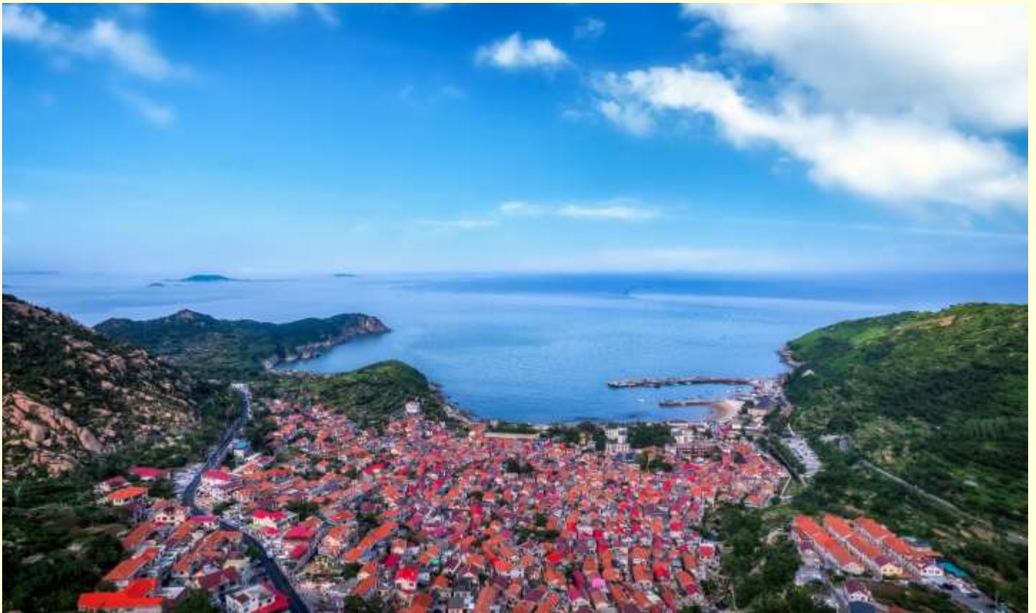
พักผ่อนชมวิวทะเลสวยงาม

นำท่านชม ถนนริมทะเล ที่สวยที่สุดในประเทศจีนถนนที่เรียงรายฝั่งทะเลกับวิวทะเลที่ทอดยาวสุดสายตา บรรยากาศสุดโรแมนติก ซึ่งอยู่รอบ ๆ กับอุทยานภูเขาเหลาซาน จากนั้นนำท่านถ่ายรูป ณ จุดชมวิวมู่บ้านชาวประมงชิงชาน มู่บ้านแก่งนี้คือมู่บ้านเก่าแก่ที่ตั้งอยู่บริเวณชายฝั่งตะวันออกของเมืองชิงเต่ามู่บ้านแห่งนี้เปี่ยมด้วยเสน่ห์ของวิถีชีวิตชาวประมงดั้งเดิม ผสานเข้ากับบรรยากาศริมทะเลอันสงบและเรียบง่าย ภายในมู่บ้านยังคงรักษาเอกลักษณ์ของบ้านเรือนสไตล์พื้นถิ่นไว้ได้อย่างดี ให้ท่านได้