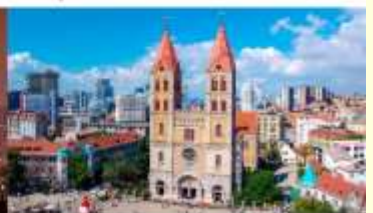
โบสถ์คริสต์เซนต์ไมเคิล

*ทางบริษัทฯ ขอสงวนสิทธิ์ในการสลับโปรแกรมทัวร์ตามความเหมาะสมขึ้นอยู่กับสถานการณ์หน้างาน โดยคำนึงถึงผลประโยชน์ของลูกค้าเป็นสำคัญ