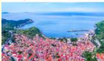
หมู่บ้านชาวประมง