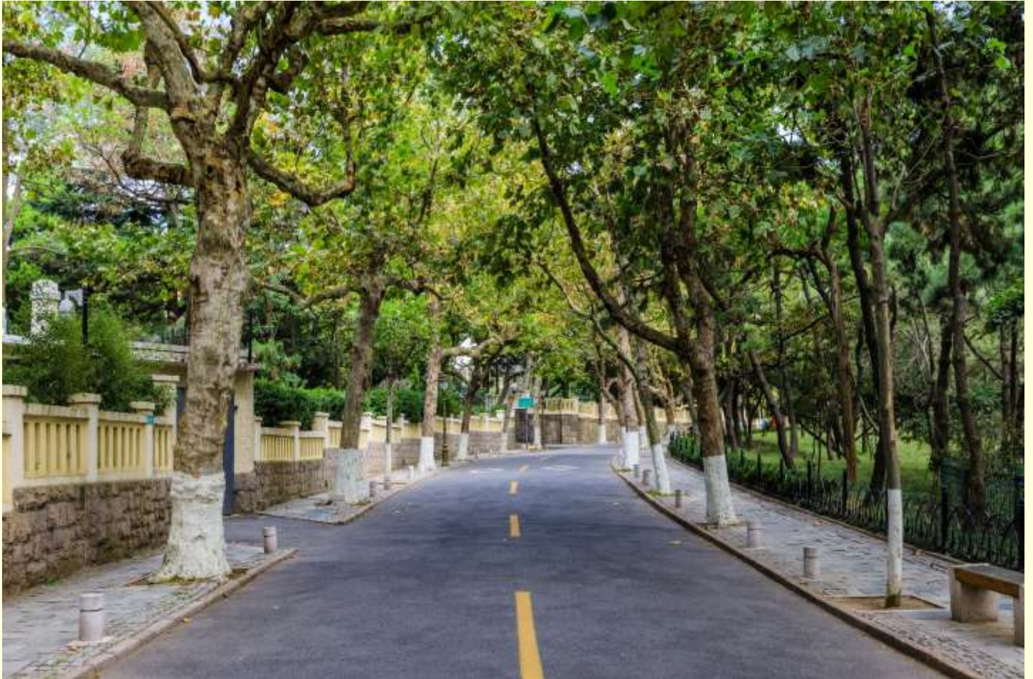
ฤดูกาล โดยเฉพาะช่วงฤดูใบไม้ผลิและฤดูใบไม้ร่วง

นำท่านชม ป่าด่างหรือย่านแปดด้าน เป็นแหล่งท่องเที่ยวสำคัญและมีชื่อเสียงแห่งหนึ่งของเมืองชิงเต่า ที่นี้เริ่มสร้างขึ้นเมื่อร้อยกว่าปีก่อน โดยชื่อมีความหมายว่า ด่านสำคัญโบราณ 8 ด้าน โดยมีสถาปัตยกรรมของ 20 กว่าประเทศที่แตกต่างกัน เช่น เยอรมนี ญี่ปุ่น อังกฤษและฝรั่งเศส ปัจจุบันได้รับการบูรณะให้คงสภาพเดิมไว้บรรยากาศรอบ ๆ เต็มไปด้วยความร่มรื่นของต้นไม้ใหญ่และสวนดอกไม้ที่เปลี่ยนตาม