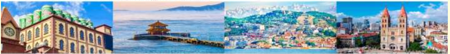
พิพิธภัณฑ์เบียร์ซิงเต่า