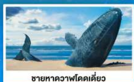
ชายหาดวาฬโดดเคียว