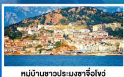
หมู่บ้านชาวประมงซาจ้อโจว