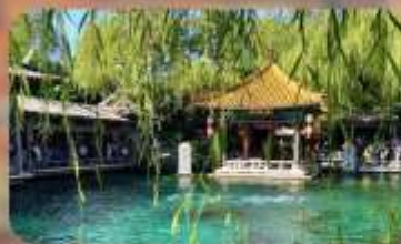
พิพิธภัณฑ์เบียร์ซิงเต่า