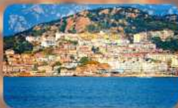
หมู่บ้านชาวประมงชาจื่อโจว