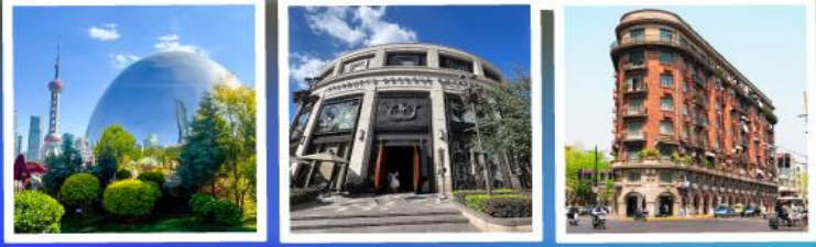
Northbund Starbucks ถนนอุคิง

ฟรีเดย์เต็มวัน หรือเลือกซื้อ option Disneyland (รวมค่าบัตรและรถรับส่ง)