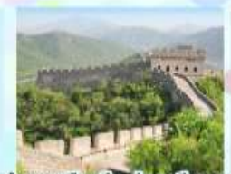
ตลาดร้อยปีเฉิงหวงเหมียว กำแพงเมืองจีน ด้านจวิยงกวน