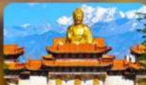
วัดพระใหญ่หวงกงซัน