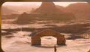
เมืองบิศาจ