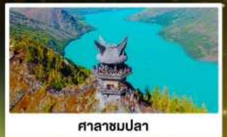
ศาลาชมปลา