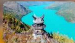
ศาลาชมปลา