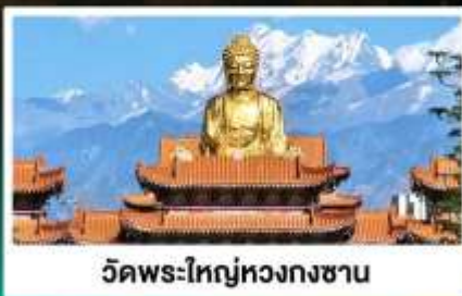
วัดพระใหญ่ทวงกงซาน