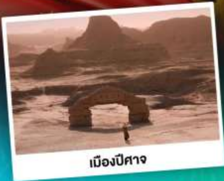
เมืองปีศาจ