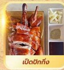
เบ็ดปักกิ่ง