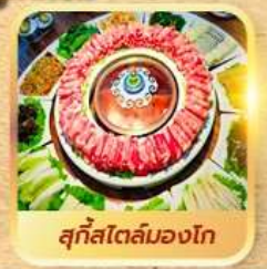
สุกีสโตล์มองโก