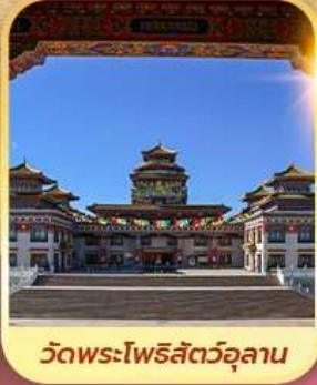
วัดพระโพธิสัตว์อูลาน