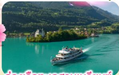
ล่องเรือทะเลสาบเบรียนซ์

พิชิตยอดเขาชูเนกกา 1 ในเขาที่สวยงามที่สุดเมืองเซอร์แมท