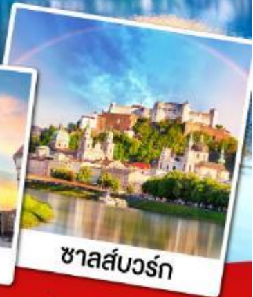
ชาลส์บวร์ก

เที่ยวหมู่บ้านอัลสตักที่สวยงามที่สุดในโลก เข้าชมความงดงามภายในของปราสาทนอยชวานสไตน์