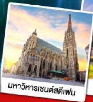
มหาวิหารเรนต์สตีเฟน