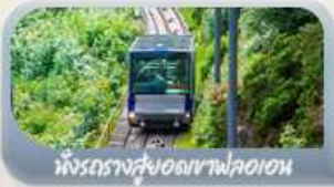
นั่งรถรางสวยอดเขาฟลอม