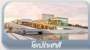
โอปราเฮาส์

📅 เดินทาง 11-19 มิ.ย. 69 / 23-31 ก.ค. 69 / 05-13 ส.ค. 69 03-11 ก.ย. 69 / 24 ก.ย.-02 ต.ค.69