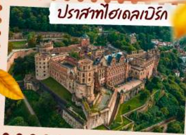
ปราสาทโฮเดคาบรีค