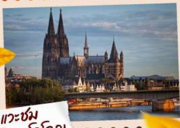
แวะชม มหาวิหารโคโลญ