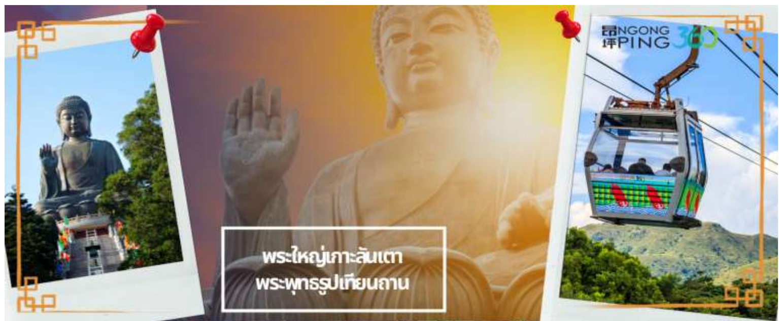
พระใหญ่เกาะลันเตา พระพุทธรูปเทียนถาน

เช้า ☉ บริการอาหารเช้า ณ ภัตตาคาร **เมนูติ่มซำต้นตำหรับฮ่องกง** (3) จากนั้นเดินทางสู่เกาะลันเตา เพื่อไปที่สถานีตุงซุง ท่านจะได้สัมผัสกับประสบการณ์ที่น่าตื่นตาตื่นใจจาก กระเช้าลอยฟ้านองปิง (NGONG PING SKYRAIL 360 **STANDARD CABIN**) ซึ่งถือได้ว่าเป็นแหล่งท่องเที่ยวอันมีเอกลักษณ์