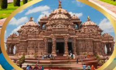
วิหารอักซาร์คัม