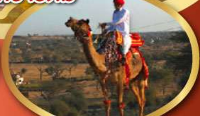
ฟรี ขี่อูฐ เมืองมันทาวา ราคาเริ่มต้น