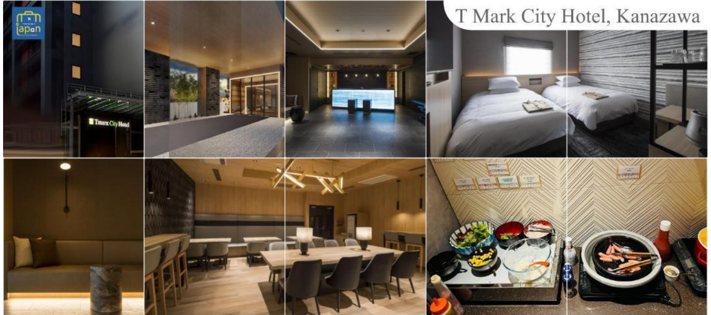
T Mark City Hotel, Kanazawa

วันที่สาม เมืองคานาซาวา – สถานีทาเทยามะ – Japan Alps ถนนสายอัลไพน์ทาเทยาม่า – กำแพงหิมะ – เชื้อนครุเบะ – สถานีโองิซาวะ – เมืองมัตสึโมโตะ