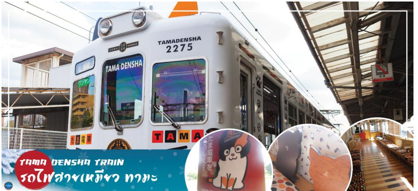
ที่ระลึกของแมวเหมียว ที่คนรักแมวไม่ควรพลาด

จากนั้นนำท่านเดินสู่ สถานีรถไฟวาคายามา (Wakayama Station) (ใช้เวลาเดินทางประมาณ 30 นาที) จากนั้นเปลี่ยนอิริยาบถ นั่งรถไฟ **นั่งรถไฟ 1 เที่ยว (อาทิจิ รถไฟทามะ, รถไฟของเล่น หรือ รถไฟสตอเบอรี่ ขึ้นอยู่กับรอบเดินทางรถไฟ ณ วันนั้นๆ) ภายในขบวนรถไฟตกแต่งให้เป็นรูปตามธีมรถไฟ ทั้งที่นั่ง โคมไฟ หรือประตู ต่างก็เป็นรูปธีมของขบวนนั้นทั้งหมด เดินทางถึง สถานีรถไฟคิชิ (Kishi Station) สถานีรถไฟที่เป็นสำนักงานประจำการ ของนายสถานีแมวเหมียว ปัจจุบัน นายสถานี คือ นิทามะ (NITAMA) แมวเหมียวสามสี เพศเมีย นอกจากนี้ท่านจะได้ชมการทำงานของนายสถานีแมวเหมียวแล้วนั้น ภายในยังมีร้านจำหน่ายสินค้า