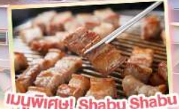
เมนูพิเศษ! Shabu Shabu และ BBQ สไตล์เกาหลี

เดินทาง พฤษภาคม - ตุลาคม 69 สายการบิน AIR BUSAN (BX) น้ำหนักกระเป๋า 15 KG