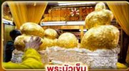
พระบิวเข้ม