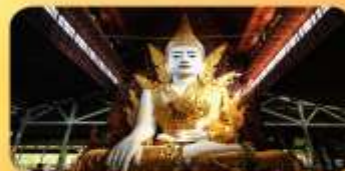
วัดหงาทัดจี