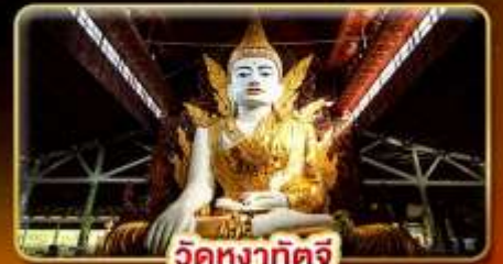
วัดหงาทักจี