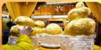
พระบิวเข้ม