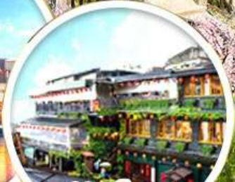
หมู่บ้านโบราณ ชิวเฟิน