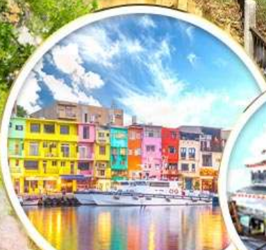
ท่าเรือสายรุ้ง