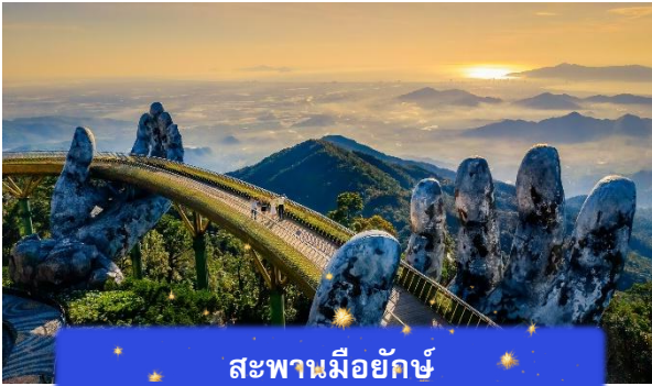
สะพานมียักษ์

เที่ยง อีสรอาหารกลางวันเพื่อความสะดวกในการท่องเที่ยว