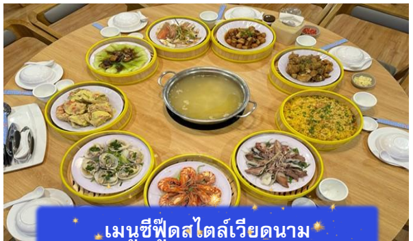
เมนูซีฟู้ดสไตล์เวียดนาม

เที่ยง บริการอาหารกลางวัน ณ ภัตตาคาร พิเศษ ... เมนูซีฟู้ดสไตล์เวียดนาม หลังอาหารกลางวันนำท่านเดินทางสู่ Coffee Palm Beach เป็นร้านกาแฟที่นอกจากท่านสามารถซื้อกาแฟเวียดนามต่างๆชิมได้แล้ว ยังสามารถซื้อเมล็ดกาแฟเป็นของฝากได้อีกด้วย ได้เวลาอันสมควร นำท่านเดินทางกลับสู่ สนามบินดานัง เพื่อเดินทางกลับสู่ประเทศไทย