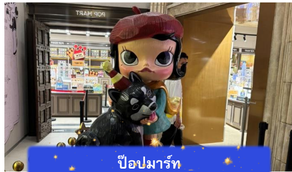
ป๊อปมาร์ท