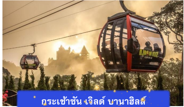
กระเช้าชั้น เจิลด์ บานาฮิลล์