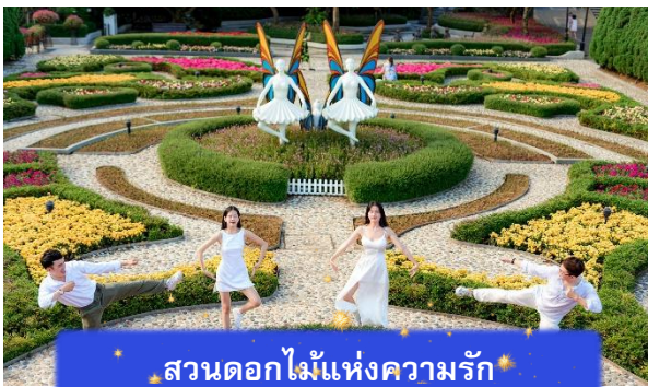
สวนดอกไม้แห่งความรัก

อิสระท่านท่องเที่ยว สวนสนุกแฟนตาซีพาร์ค ซึ่งมีเครื่องเล่นหลากหลายรูปแบบ เช่น ทำทายความมันส์ของหนัง 4D ระทึกขวัญกับบ้านผีสิง เกมส์สนุกๆ เครื่องเล่นเบาๆ รถบั๊ม หรือจะเลือกซื้อป๊อปปิ้งของที่ระลึกของสวนสนุก และ จัตุรัสแห่งดวงดาว เปรียบเสมือนการเดินทางสู่อาณาจักรแห่งดวงดาวที่มีเส้นทางเชื่อมต่อระหว่างอาณาจักรแห่งดวงจันทร์และอาณาจักรแห่งดวงอาทิตย์ถนนที่แสนงดงาม และสถาปัตยกรรมที่ล้ำสมัยจุดเด่นของที่แห่งนี้ก็คือกระจกใสทรงสามเหลี่ยมที่ดูคล้ายกับพิพิธภัณฑสถานลูฟวร์ที่ฝรั่งเศส ให้ความรู้สึกเหมือนท่านกำลังท่องอยู่ในโลกแห่งเวทมนต์และดวงดาว (ไม่รวมค่าเข้าชมหุ่นซีไฟิ่งราคาประมาณ 1 แส่นดอง)