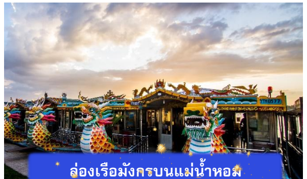
* ล่องเรือมังกรบนแม่น้ำหอม

ที่พัก THANH BINH HOTEL ระดับ 4 ดาวมาตรฐานท้องถิ่น หรือเทียบเท่า