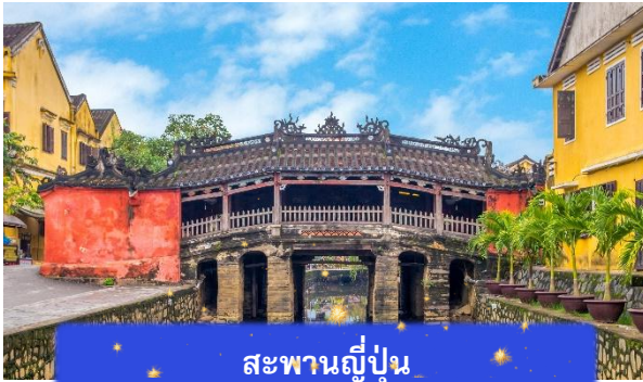
สะพานญี่ปุ่น

จากนั้นนำท่านเดินทางสู่ เมืองโบราณฮอยอัน เมืองมรดกโลกที่ยังคงเอกลักษณ์และรักษาวัฒนธรรมไว้อย่างดีเยี่ยม โดยท่านสามารถเดินเล่น ถ่ายรูป ตามตรอกซอกซอยต่างๆ ได้ ไฮไลท์ของการมาถ่ายรูปเช็คอินที่นี่คือการได้ขึ้นไปถ่ายรูปจากมุมสูงของคาเฟ่ที่อยู่ตามซอกซอย นำท่านชม สะพานญี่ปุ่น สะพานแห่งมิตรไมตรี ที่ได้ชื่อนี้เนื่องจากสะพานแห่งนี้สร้างขึ้นโดยชุมชนชาวญี่ปุ่น เป็นสะพานที่สร้างขึ้นข้ามคลองที่ในอดีต 400 ปีกว่าที่ผ่านมา