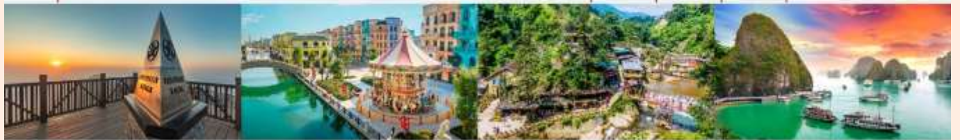
ฟานซิปิน