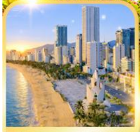
ชายหาดญาจาง