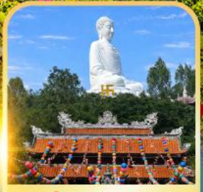
วัดลองเซิน