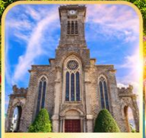
โบสถ์หินญาจาง