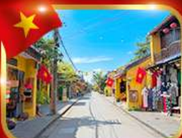
เมืองมรดกโลก ฮอยอัน