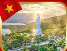
ขอพรกวนอิม วัดหลันอึ้ง