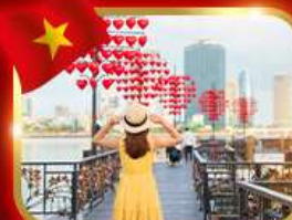
เช็किनสะพานแห่งความรัก