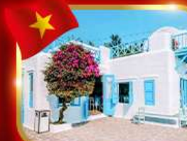
คาเฟ่สุดชิค ชามทรา มาริน่า