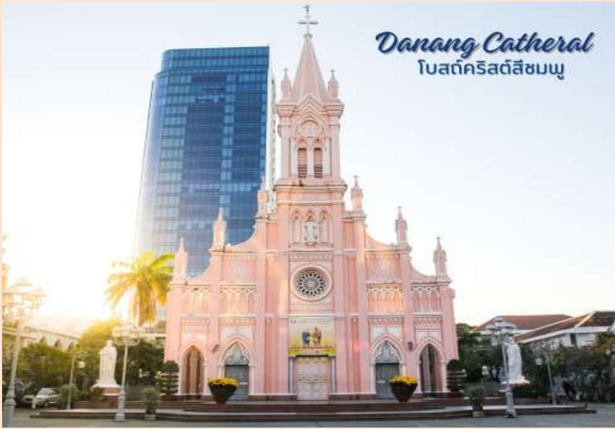
Danang Cathedral โบสถ์คริสต์สีชมพู

นำท่านถ่ายรูป โบสถ์คริสต์ดานัง หรือโบสถ์คริสต์สีชมพู (Danang Cathedral) สร้างขึ้นสมัยเวียดนาม ตกเป็นอาณานิคมของฝรั่งเศส สถาปัตยกรรมสไตล์โกธิก ยตกแต่งด้วยความประณีตสวยงาม ตัวโบสถ์เป็นสีชมพูทั้งหลัง ตัดขอบด้วยสีขาว เป็นอีกหนึ่งสถานที่ที่ไม่ควรต้องพลาดเมื่อมาเยือนเมืองดานัง จากนั้น อิสระช้อปปิ้ง ตลาดฮาน อิสระเลือกซื้อสินค้าหลากหลายชนิด เช่นผ้า เหล้า บุหรี่ และของกินต่างๆ เป็นตลาดสดและขายสินค้าพื้นเมืองของเมืองดานัง