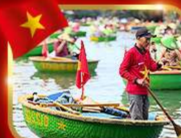
เรือกระด้ง หมู่บ้านกัมทาน