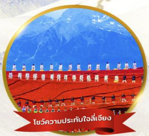
โซว์ความประทับใจลี่เจียง