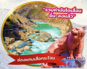
"รวมค่าบัตรเดินรถไฟขึ้น-ลงแล้ว"