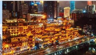
หงหยาดัง(ตอนกลางคืน)

*ทางบริษัทฯ ขอสงวนสิทธิ์ในการสลับโปรแกรมทัวร์ตามความเหมาะสมขึ้นอยู่กับสถานการณ์หน้างาน โดยคำนึงถึงผลประโยชน์ของลูกค้าเป็นสำคัญ