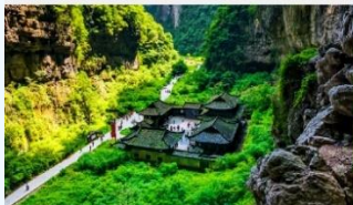
อุทยานแห่งชาติหลุมฟ้า