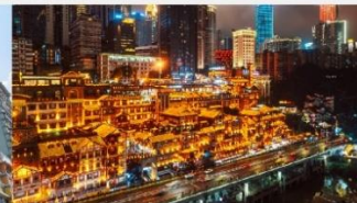
หงหยาดิง(ชมไฟยามค่ำคืน)

*ทางบริษัทฯ ขอสงวนสิทธิ์ในการสลับโปรแกรมทัวร์ตามความเหมาะสมขึ้นอยู่กับสถานการณ์บ้านเมือง โดยคำนึงถึงผลประโยชน์ของลูกค้าเป็นสำคัญ