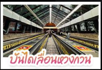
บันไดเลื่อนแขวงกาน