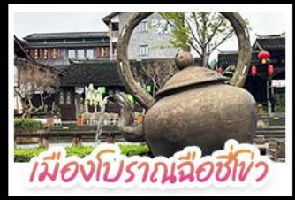
เมืองโบราณเฉิงชิ่ง