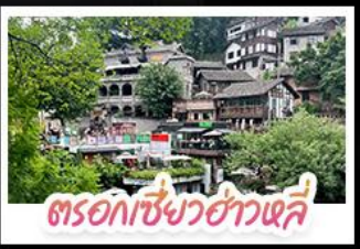
ตรอกชาเขียวชาวจี