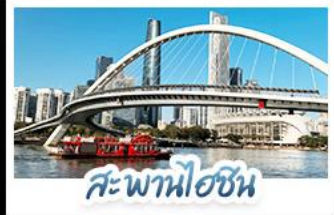
สะพานโฮชิน

บินตรงกวางโจว • จัดเต็มเที่ยวสวนสนุกกลางแปลงเต็มวัน เที่ยวจีนฟีลยุโรป ชมสถาปัตยกรรม ณ เกาะซาเมียน สักการะวัดพระใหญ่ พูกรูปเก่าแก่กว่า 1,000 ปี ใจกลางเมืองกวางโจว เช็กอินกับแลนด์มาร์กสุดฮิตจตุรัสฮวาเจ็งทำยูรูกับหอกวี ซ้อปิ้งเพลิน ถนนคนเดินอีโต้และถนนคนเดินปิกกิง