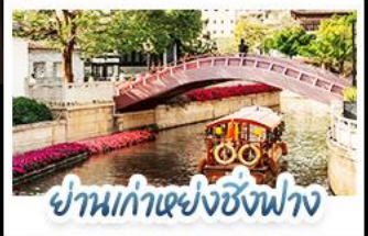
ย่านเก่าชังฟาง