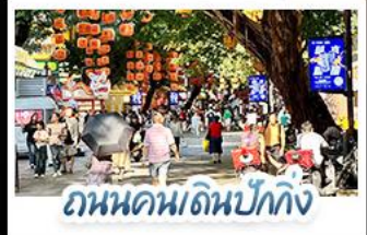
ถนนคนเดินอีโต้