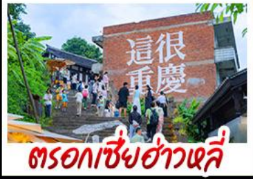
ตรอกเซี่ยฮ่าวหลี่