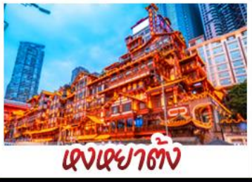
ตึกหยาดัง