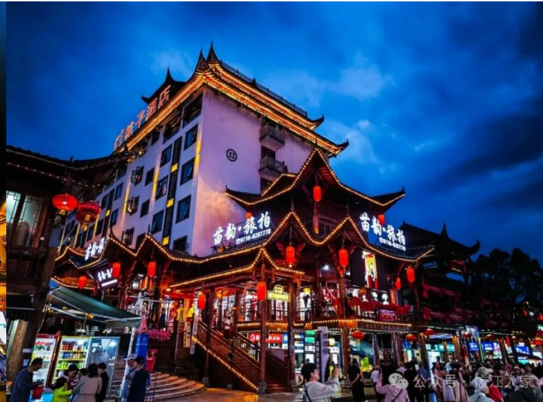
ถ่ายภาพสวยๆ ให้ผู้มาเยือนได้เก็บความประทับใจ