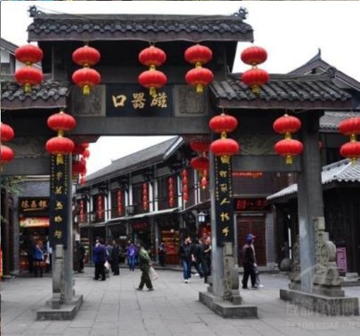
สืบทอดกิจการต่อกันมาหลาย รุ่น