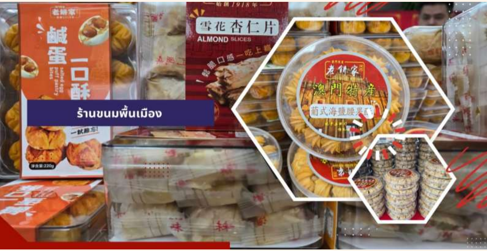
ร้านขนมพื้นเมือง