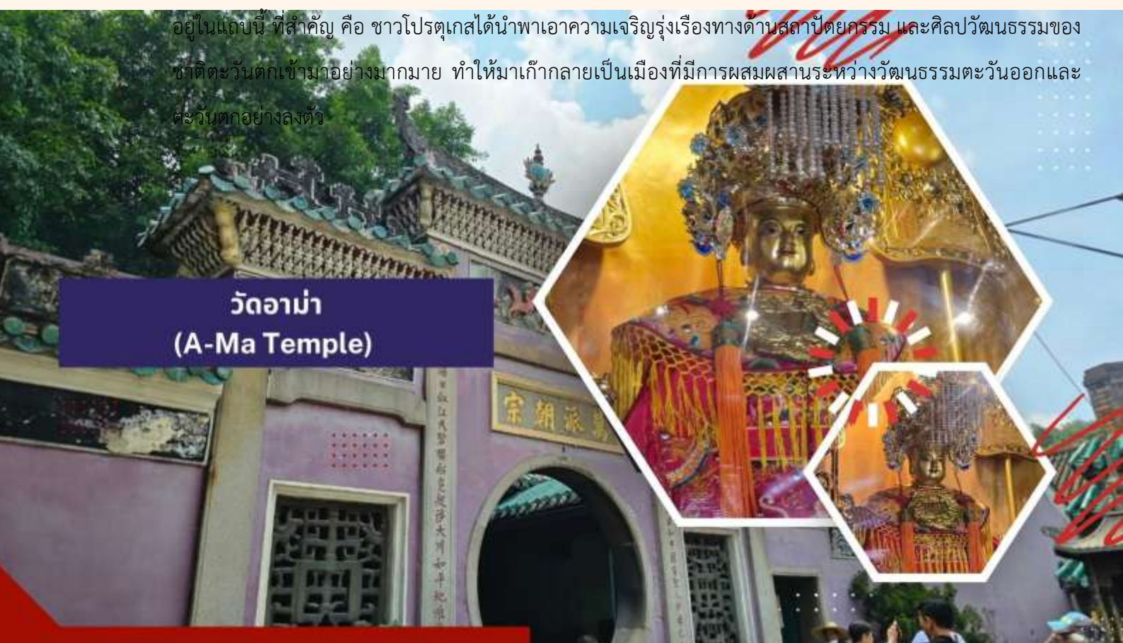
วัดอาม่า (A-Ma Temple)

นำท่านเดินทางสู่ มาเก๊า (ในการเดินทางข้ามด่าน ท่านจะต้องลากกระเป๋าสัมภาระของท่านเองและผ่านพิธีการตรวจคนเข้าเมืองใช้เวลาในการเดินประมาณ 45-60 นาที) ในอดีตมาเก๊าเป็นเพียงแค่มุมบ้านเกษตรกรรมและประมงเล็กๆ ซึ่งเป็นเมืองที่มีประวัติศาสตร์ยาวนาน โดยมีชาวจีนกวางตุ้งและฟูเจี้ยนเป็นชนชาติดั้งเดิม จนมาถึงช่วงต้นศตวรรษที่ 16 ชาวโปรตุเกสได้เดินเรือเข้ามายังคาบสมุทรแถบนี้เพื่อติดต่อค้าขายกับชาวจีน และมาสร้างอาณานิคมอยู่ในแถบนี้ ที่สำคัญ คือ ชาวโปรตุเกสได้นำพาเอาความเจริญรุ่งเรืองทางด้านสถาปัตยกรรม และศิลปวัฒนธรรมของชาติตะวันตกเข้ามาอย่างมากมาย ทำให้มาเก๊ากลายเป็นเมืองที่มีการผสมผสานระหว่างวัฒนธรรมตะวันออกและตะวันตกอย่างลงตัว