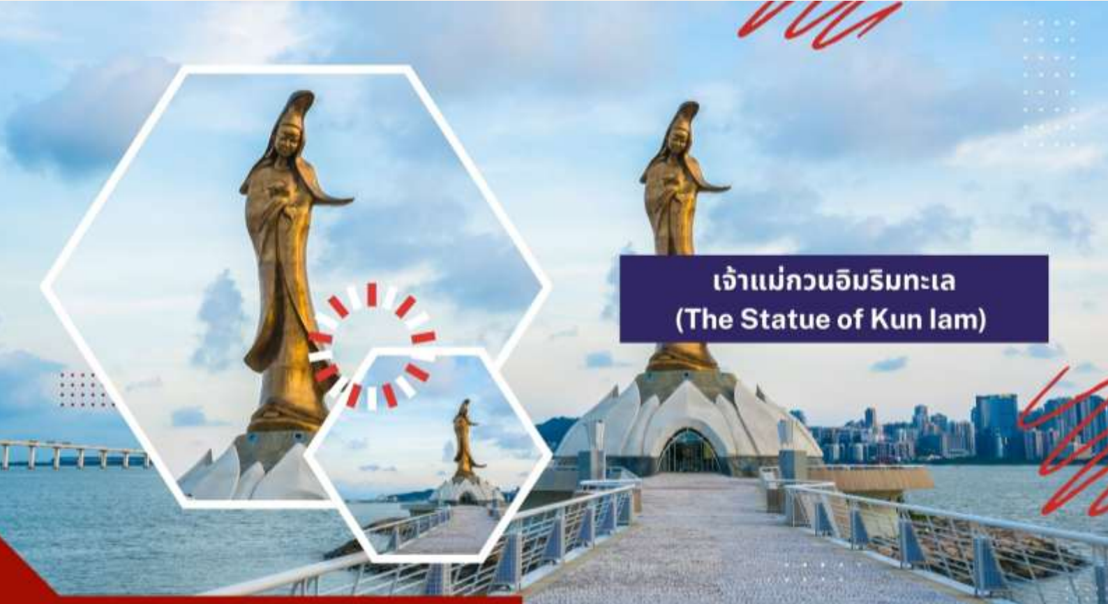
เจ้าแม่กวนอิมริมทะเล (The Statue of Kun lam)

นำท่านแวะ ร้านขนมพื้นเมือง ให้ท่านได้ชิมและซื้อขนม รวมถึงวิตามินต่างๆ ในราคาโดนใจ อาทิ เช่น วิตามินสกัดจากปลาทะเลน้ำลึก, น้ำมันผึ้งที่ช่วยบำรุงผิวพรรณ หรือหมูแผ่น เป็นต้น