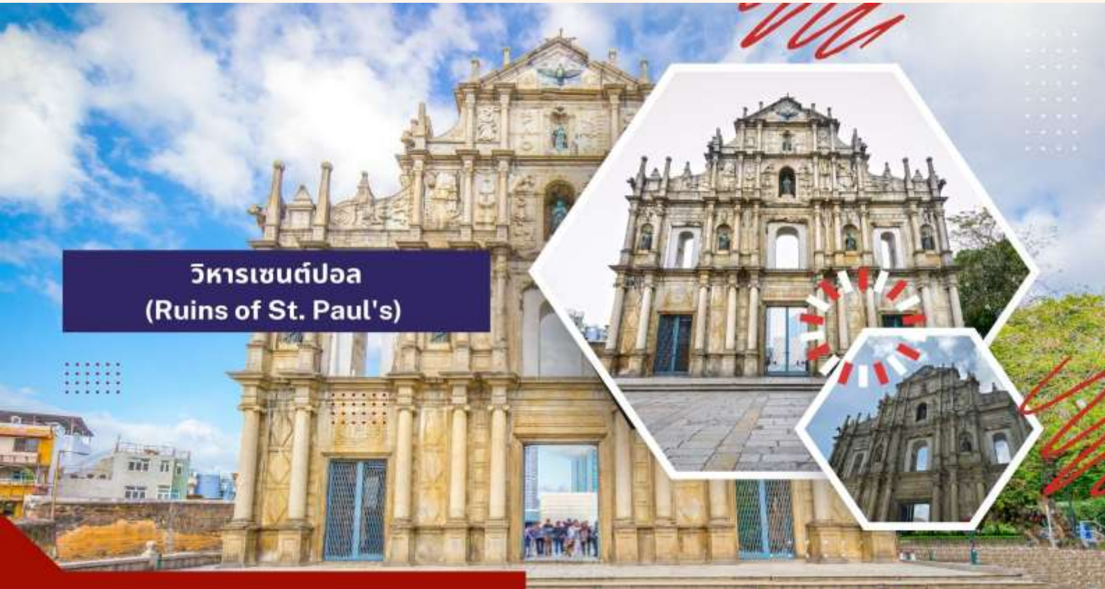
วิหารเซนต์ปอล (Ruins of St. Paul's)

ศาลที่ได้มีการสร้างเพื่อถวายให้แก่เจ้าแม่ทับทิม