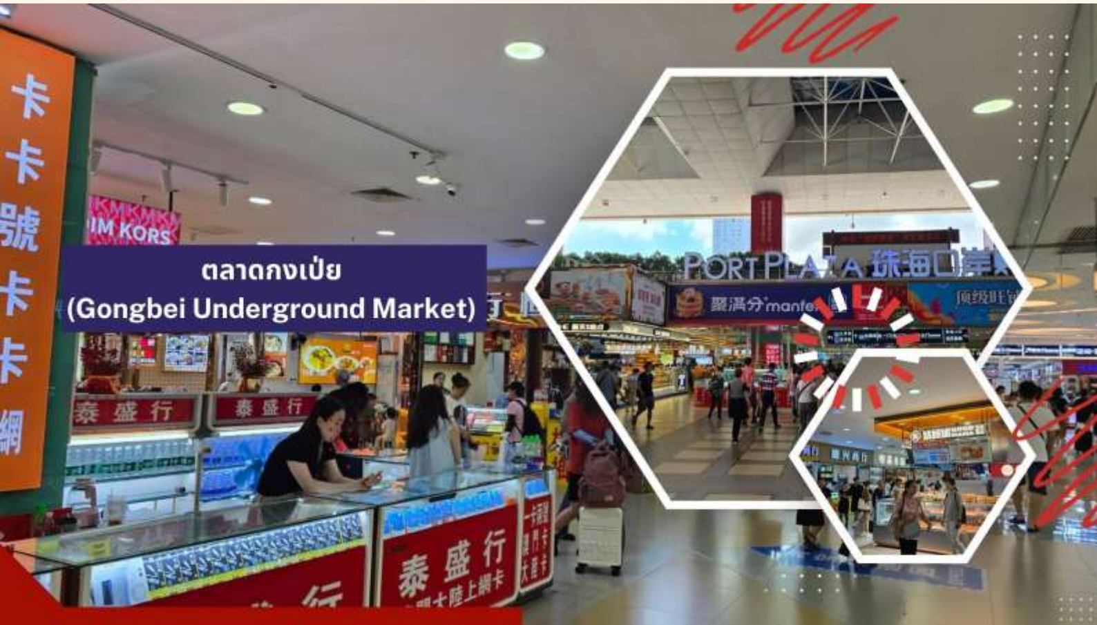
ตลาดกงเป๋ย (Gongbei Underground Market)

นำท่านช้อปปิ้ง ตลาดกงเป๋ย (Gongbei Underground Market) แหล่งช้อปปิ้งยอดนิยมของเมืองจูไห่ ท่านจะสนุกสนานกับการต่อรองสินค้าราคาถูก มีสินค้านานาชนิด ทั้งกระเป๋า เสื้อผ้า ถุงเท้า รองเท้า เครื่องประดับสำหรับคุณผู้หญิง ให้ท่านได้เลือกช้อปปิ้งอย่างจุใจ