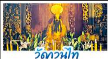
วัดวาทิท

เที่ยวครบ แลนด์มาร์คดัง! โบสถ์เซนต์ปอล - เจ้าแม่กวนอิมริมทะเล THE VENETIAN - THE PARISIAN จูไห้ฟิชเชอร์เทียร์ล - โรงละครหอยไข่มุก พระราชวังหยวนหมิงหยวน - วัดอาปา - วัดกวนไท