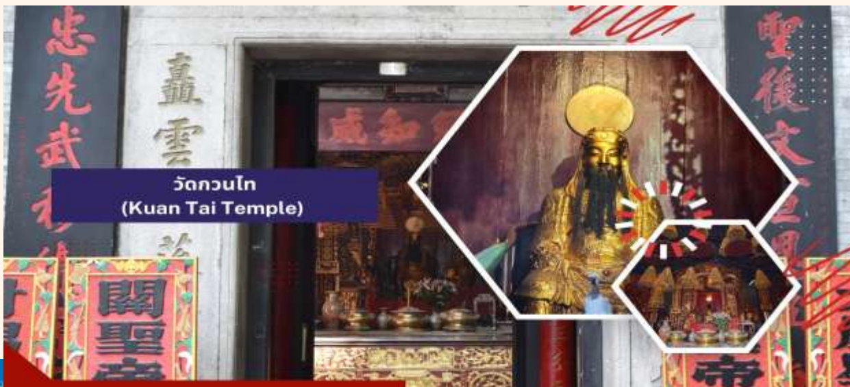
วัดกวนไท (Kuan Tai Temple)

นำท่านชม วิหารเซนต์ปอล (Ruins of St. Paul's) โบสถ์แห่งนี้เคยเป็นส่วนหนึ่งของวิทยาลัยเซนต์ปอล ซึ่งก่อตั้งในปี ค.ศ. 1594 และปิดไปในปี ค.ศ. 1762 และเป็นมหาวิทยาลัยตามแบบตะวันตกแห่งแรกของเอเชียตะวันออก โบสถ์เซนต์ปอลสร้างขึ้นในปี ค.ศ. 1580 แต่ถูกทำลายถึงสองครั้ง ในปี ค.ศ.1595 และ ค.ศ.1601 ตามลำดับ จนกระทั่งเกิดเพลิงไหม้ในปี ค.ศ. 1835 ทั้งวิทยาลัย และโบสถ์ถูกทำลายจนเหลือแต่ด้านหน้าของตึกฐานโบสถ์ส่วนใหญ่และบันไดด้านหน้าของตึกแสดงให้เห็นถึงสไตล์ผสมระหว่างตะวันออกและตะวันตกและมีอยู่ที่นี่เพียงแห่งเดียวเท่านั้นในโลก