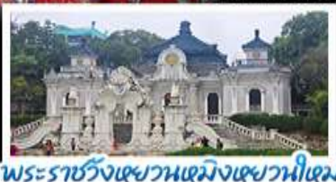
พระราชวังเซวานเหมิงเซวานเหมิง