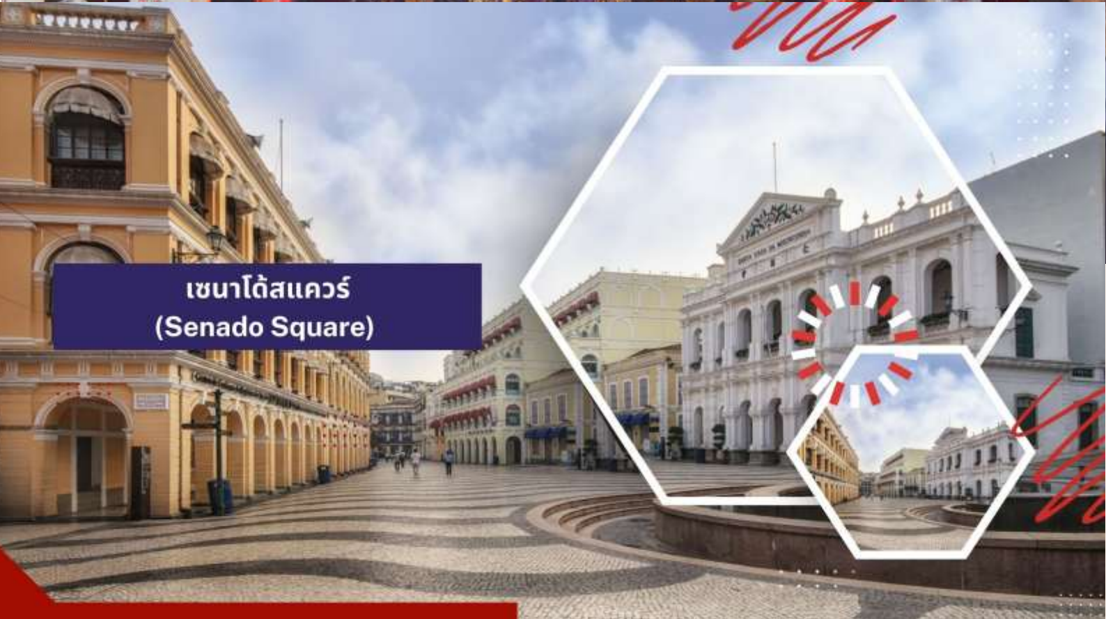
เซนาโดสแควร์ (Senado Square)

จากนั้นนำท่านเดินทางสู่ เซนาโดสแควร์ (Senado Square) อิสระให้ท่านได้เดินเที่ยวและเลือกซื้อสินค้าตามอัธยาศัย