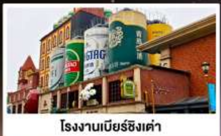
โรงแรมเบียร์ชิงเต่า