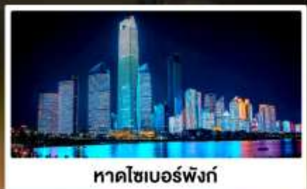
หาดไซเบอร์ฟิงก์