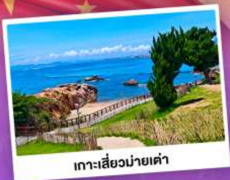
เกาะสี่ถ่านายเต่า

เที่ยวชิงเต่า เมืองทะเลสุดชิล ครบทั้งกิน เที่ยว ถ่ายรูป