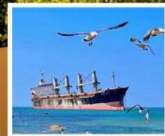
เรือสินค้ากยศันบลูวิส