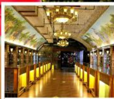
พิพิธภัณฑ์ไวน์ชิงเต่า