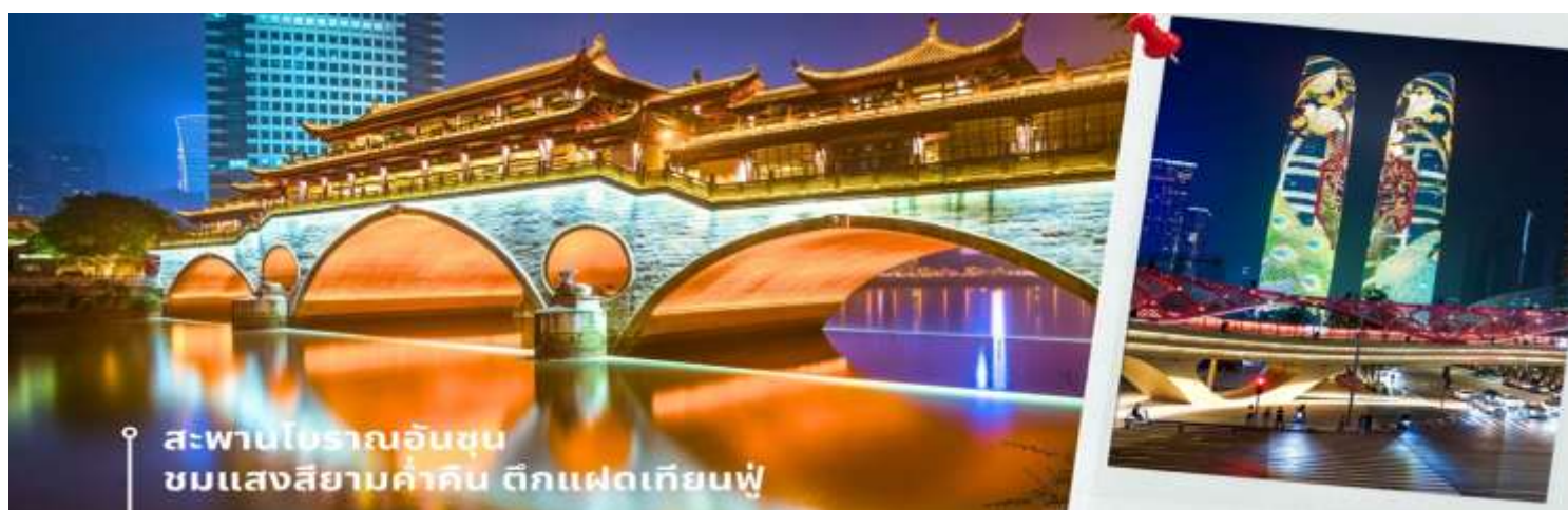
สะพานโบราณอันชุน ชมแสงสียามค่ำคืน ตึกแฝดเทียนฟู

นำท่านชม สะพานโบราณอันชุน-พร้อมชมแสงสียามค่ำคืน ตึกแฝดเทียนฟู เป็นสะพานข้ามคลองที่สร้างเป็นเหมือนอาคารอยู่ข้างบน ในช่วงเวลายามเย็นจะเป็นช่วงที่ผู้คนออกมาชมบรรยากาศบริเวณของสะพานแห่งนี้ และมีร้านค้ามากมาย รวมไปถึงบาร์เครื่องดื่มต่างๆ ที่ดึงดูดนักท่องเที่ยวได้เป็นอย่างดี เป็นสะพานที่ทอดข้ามแม่น้ำจินเจียง