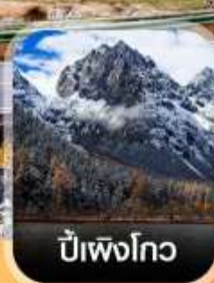
ปี๋เฟิงโกว

✈️ คอนเฟิร์มออกเดินทาง ทุกพีเรียด 2 ท่านขึ้นไป