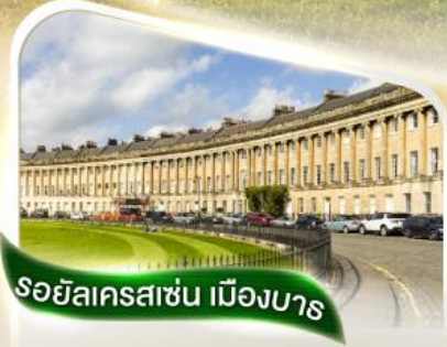
รอยัลครอสเชน เมืองบาส