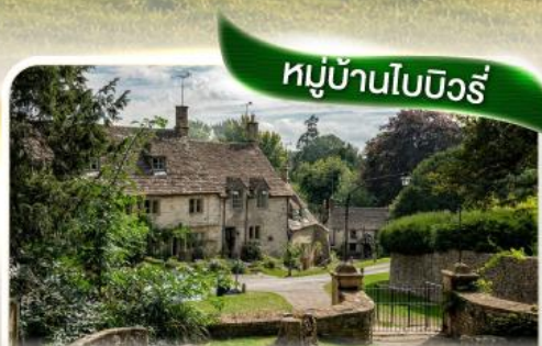
หมู่บ้านไบบิวรี่