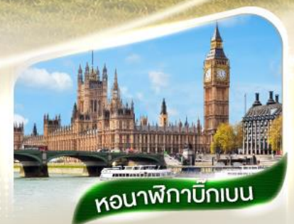
หอนาฬิกาบิกเบน