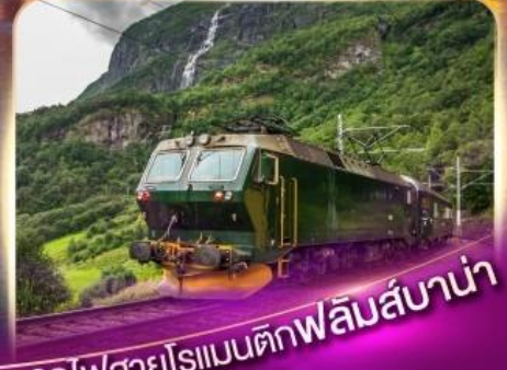
รถไฟสายโรแมนติกฟลิมส์บานา