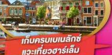
เก็บครบเบเนลักซ์ แวะเที่ยวฮาร์เล็ม