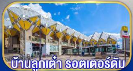
บ้านลูกเต่า รถเตอร์ดัม

เยือนเมืองเก่าแก่ยุโรป เกือบไฮไลต์กลุ่มประเทศเบเนลักซ์ กับการบินไทย บินตรงอัมสเตอร์ดัม