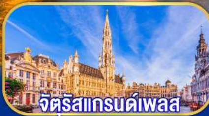
จัตุรัสแกรนด์เพลส