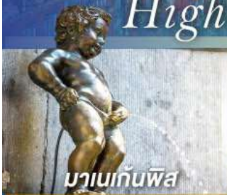
มานเนกันพิส